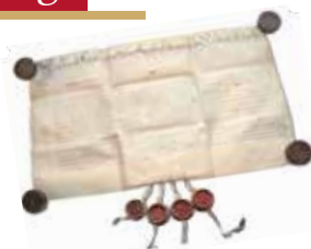
Die Osingurkunde mit angehängten Siegeln

Die uralte Tradition immer wieder neu durchführen – in dem Osing-Brief von 1587 wird das Umverteilen der Feldstücke beschrieben. Die Osingverwaltung führt die streng geregelten Vorbereitungen und Verlosung der 1 Tagwerk (0,33 ha) großen Feldstücke durch und ermittelt somit den neuen Besitzer/Rechtlter für die nächsten zehn Jahre.