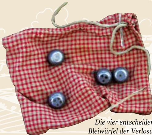
Die vier entscheidenden Bleiwürfel der Verlosung